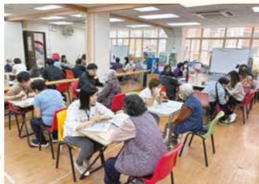
實習學生向參加者分享營養資訊。

社區營養服務在3月17日為修讀香港大學專業進修學院「社區營養深造證書」(Postgraduate Certificate in Community Nutrition)的學生安排實習機會，向宏施慈善基金的使用者提供健康教育及篩查服務，內容包括量度身高及體重，及進行營養和肌少症風險評估，並提供合適的健康飲食資訊。