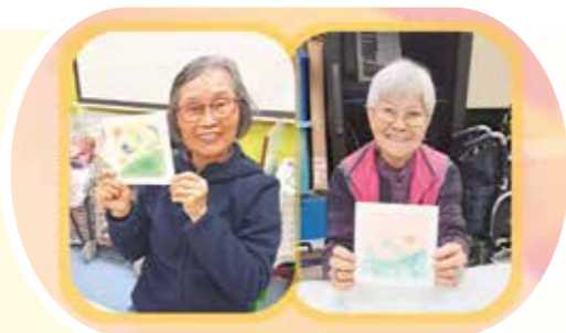
參加者展示和諧粉彩創作的成品。

大埔家居照顧及支援服務隊於2月24日舉辦「愛動樂」和諧粉彩創作小組活動，活動有8位服務使用者參與其中，均對活動展現濃厚興趣。大家在創作過程中彼此交流與鼓勵，為活動增添歡樂與溫度。