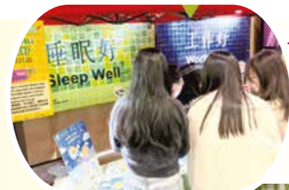
社康與香港理工大學專業進修學院及東華學院合作，在校園設立「樂眠攤位」，透過互動遊戲向師生推廣睡眠健康知識及服務。