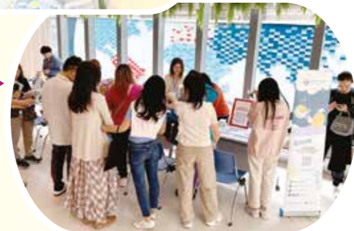
社康與油尖旺康健中心合作舉辦「樂眠攤位」，並繼續與紅十字會總部合辦睡眠健康的推廣活動。