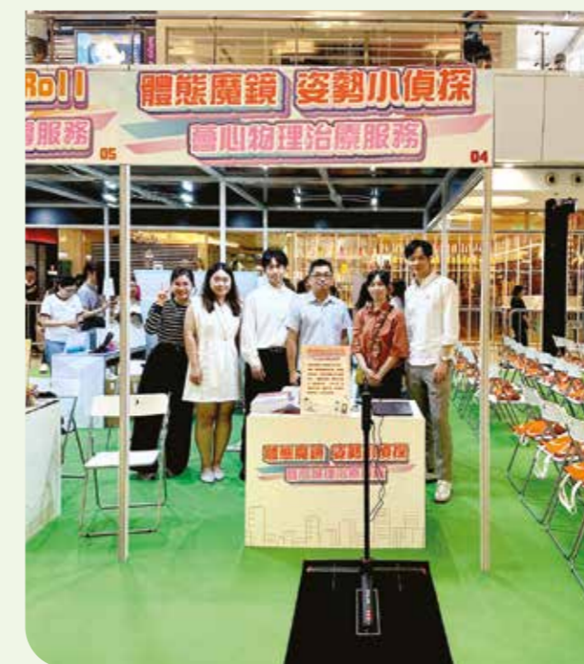
「社區復康服務」團隊

「社區復康服務」團隊除了在多區的診所為患者提供治療，亦積極推行外展服務，為長者中心長者提供檢查，確保其痛症得到適切治療。同時亦為行動不便者提供一對一物理治療服務，協助長者舒緩痛症及提升肌肉力量。另一層面，團隊深信「預防勝於治療」，一直積極向公眾提供健康講座與教育活動，並與觀塘地區康健站合作，為市民提供多元化班組活動，包括健體運動、器材使用指導、預防跌倒及勞損護理等，提升大眾自我管理健康的能力。未來，團隊將投放更多資源關注市民的「亞健康」問題，推廣正確健康知識，協助大眾及早預防慢性疾病，攜手建立更健康的社區。