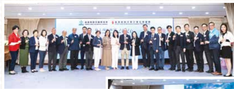
一眾嘉賓聯同董事會及管理委員會成員上台祝酒，與同工一同分享喜悅。