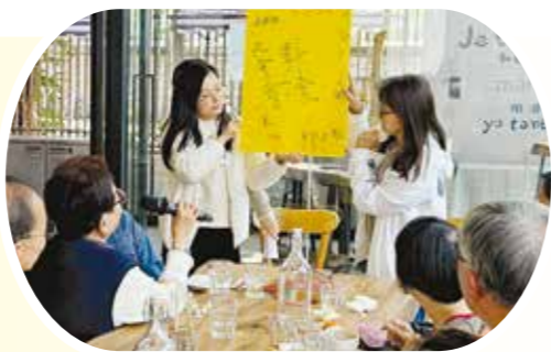
義工們幫忙分享一眾宏福苑會員未來有興趣參與的活動。

當天亦有安排熱心義工關懷會員及跟進需要；活動氣氛溫馨融洽，大家度過了既溫馨又愉快的一天。