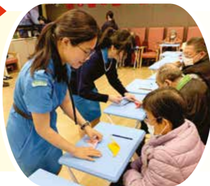
嘉諾撒聖瑪利書院的學生與長者互動，氣氛融洽。

嘉諾撒聖瑪利書院的師生到訪鯉魚門長者日間護理中心。學生與長者一起做手工和玩遊戲，並送上禮物及心意卡等祝福。活動不僅拉近彼此距離，學生亦從中學到到關愛與尊重。