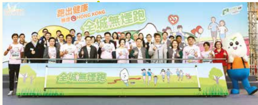
「全城無煙跑」活動的參與單位。

社康的「戒煙計劃」在2月14日參與吸煙與健康委員會舉辦的「全城無煙跑」活動，並於現場設置遊戲攤位，向大眾推廣無煙生活及戒煙資訊，提升市民對吸煙危害的認識。